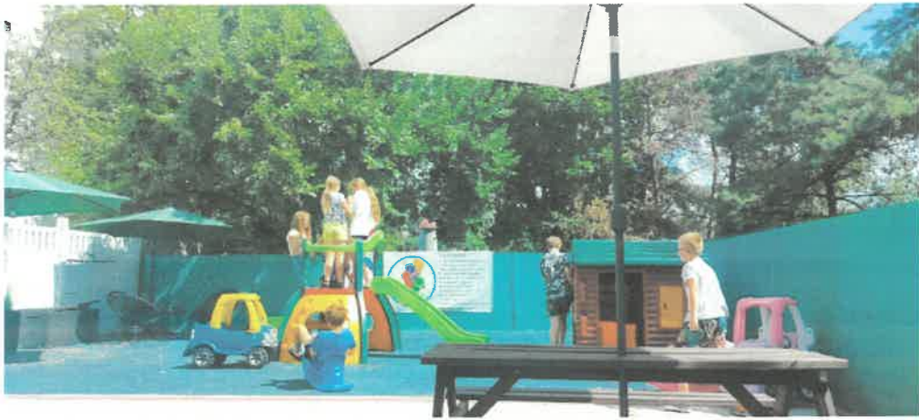
➤ Grupa zabawowa