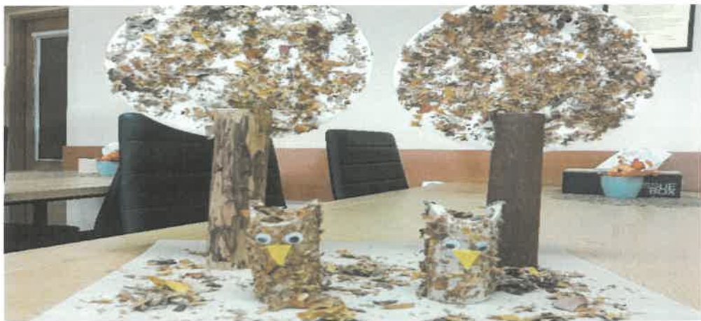
➤ Warsztaty rodzinne